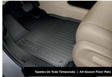
Tapetes de Toda Temporada | All-Season Floor Mats