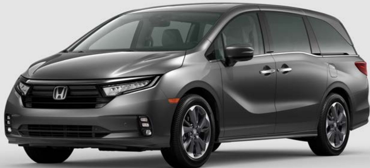
Odyssey Elite mostrada en Modern Steel Metallic | Odyssey Elite shown in Modern Steel Metallic