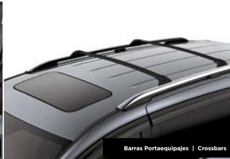
Barras Portaequipajes | Crossbars