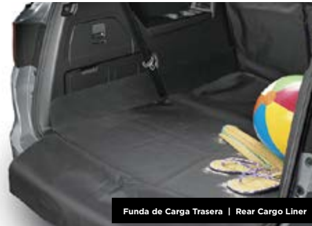
Funda de Carga Trasera | Rear Cargo Liner