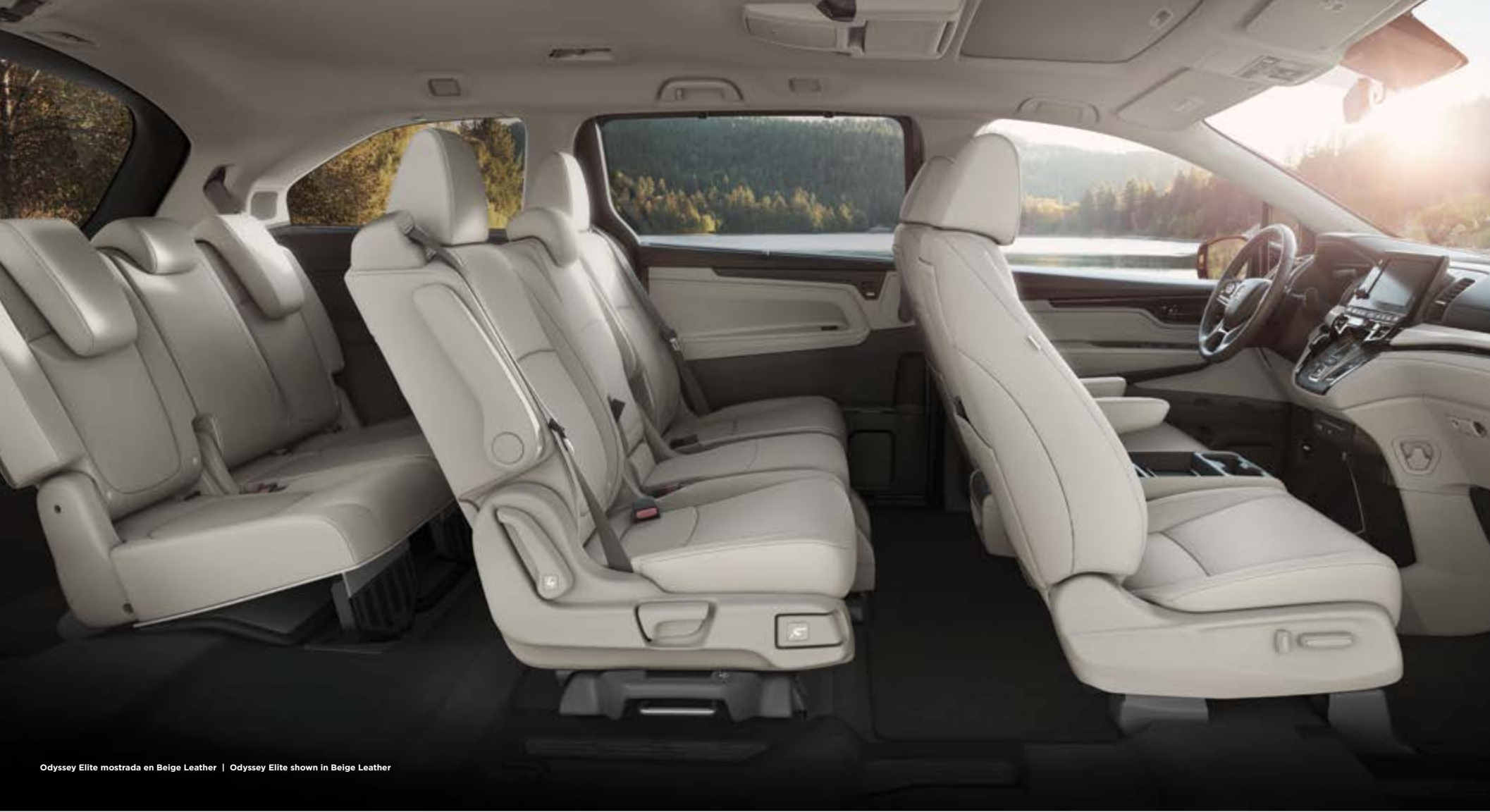
Odyssey Elite mostrada en Beige Leather | Odyssey Elite shown in Beige Leather