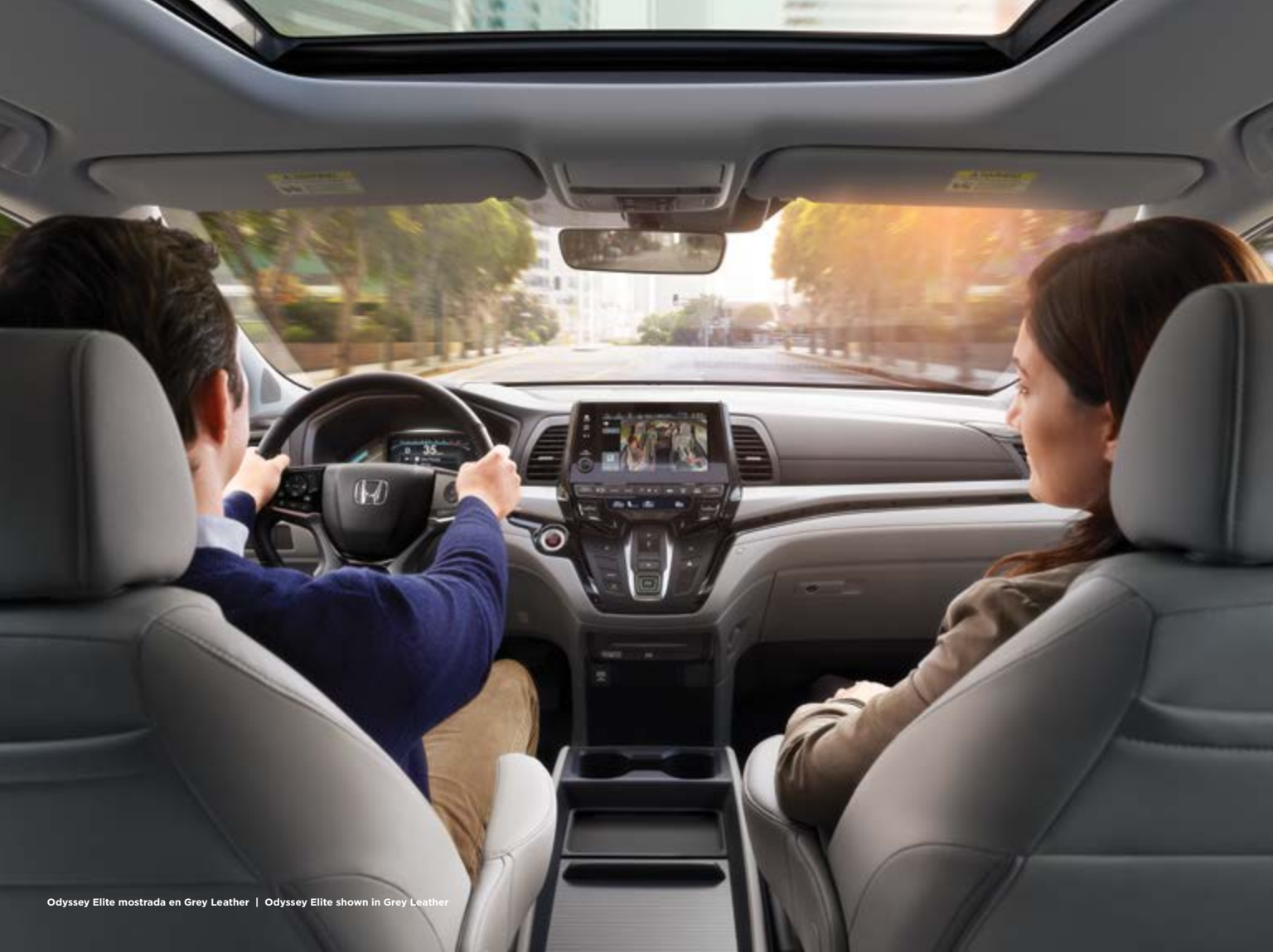
Odyssey Elite mostrada en Grey Leather | Odyssey Elite shown in Grey Leather